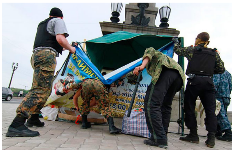
Пророссийские боевики разрушают палатку Молитвенного марафона на площади Конституции, май 2014