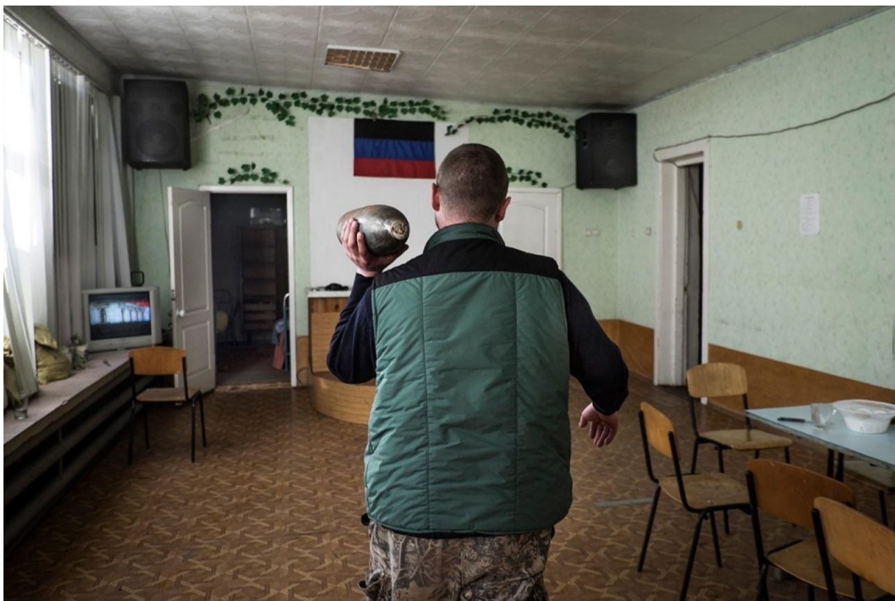
Боевик ДНР, несущий снаряд по помещению Церкви Христовой. Донецк, март 2015 года.

Другая группировка пророссийских боевиков заняла здание церкви в ноябре 2014 года, и по состоянию на март 2015 года здание использовалось как военный лагерь сепаратистов. 42 Со времени захвата здания Церкви Христовой около 100 её прихожан продолжают собираться в тайных местах, разбросанных по всему Донецку. Когда Крыжановского спросили, не боится ли он, что незаконные комбатанты запретят их Церкви собираться для молитвы по домам, он ответил: «Мы не боимся, ведь и первых христиан также преследовали. Но они не боялись проповедовать Иисуса Христа». 43