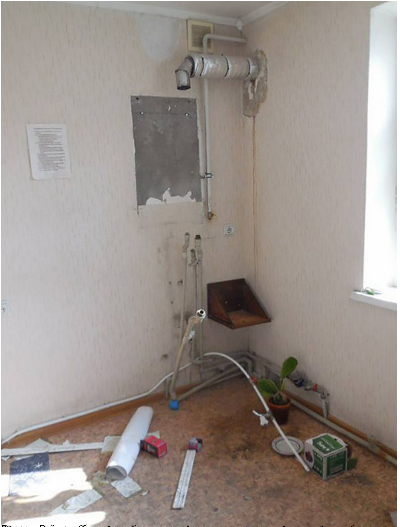
До взорвання будинку баптистів в місті Луганськ, в будинку були розбиті вікна, вилучені мебелі та речі, вилучені гроші та документи.