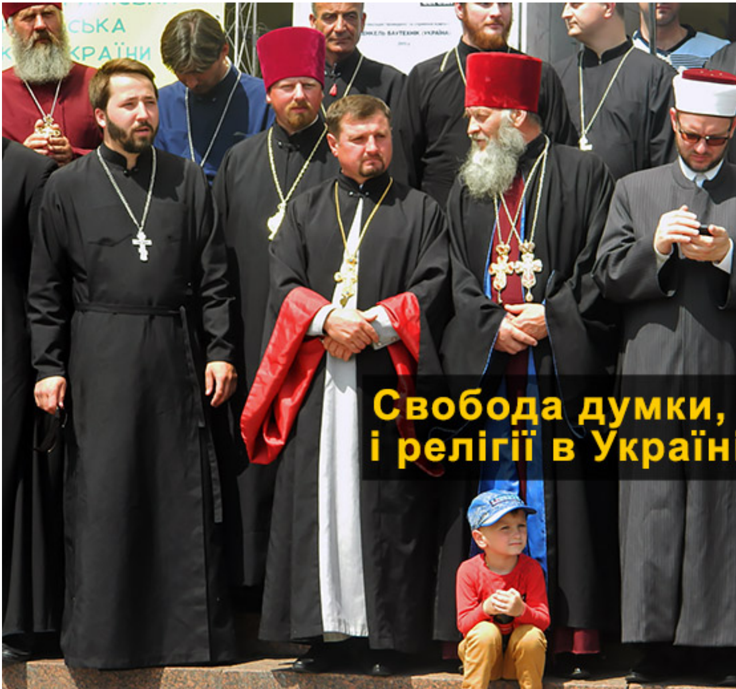
Витяг з Доповіді правозахисних організацій “Права людини в Україні – 2016” , підготовленої за сприяння Української Гельсінської спілки з прав людини.